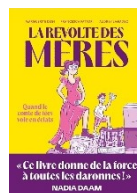
La révolte des mères