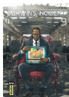
T9 Manga Darwin's incident