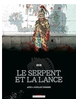
T4 le serpent et la lance