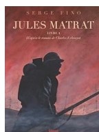
Jules Matrat T1 à 3