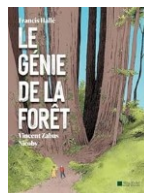
Francis Hallé Le génie de la Forêt